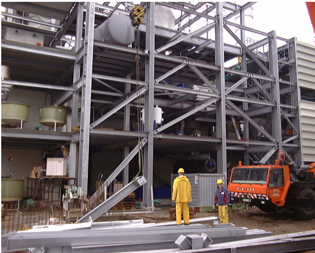
Refiner-Wäscher (RW) während der Ausführung